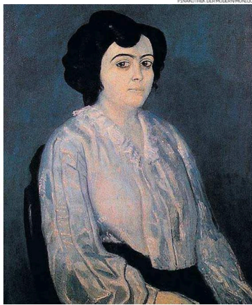
PINAKOTHEK DER KUNSTEN MÜNCHEN

Mas agora as Coleções de Pintura do Estado da Baviera, de propriedade do Estado da Baviera, se recusam a encaminhar o caso de um Picasso à comissão, rompendo com a tradição que atraiu o escrutínio do governo e uma advertência do presidente